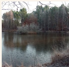
ROUTE DE LANDIRAS