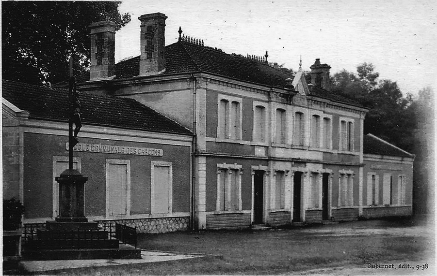
3. - BALIZAC (Gironde). — La Mairie