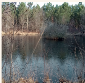
ROUTE DE LANDIRAS